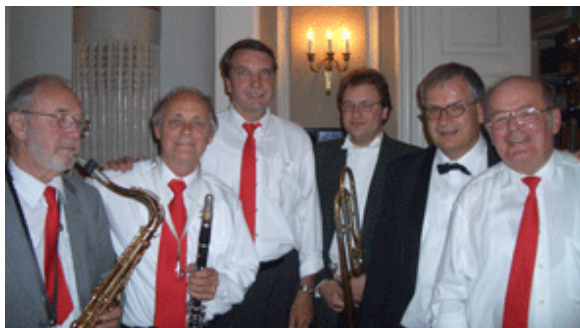
Skovshøjrup og Omegns Swingband